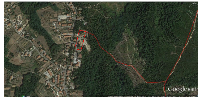
Nel riquadro, il parcheggio di Cerretti e il percorso ciclopeditre che conduce alla Farnia di Tonsana (direzione Sud) e alla ciclopeditonale di Montefalcone (direzione Nord Est)